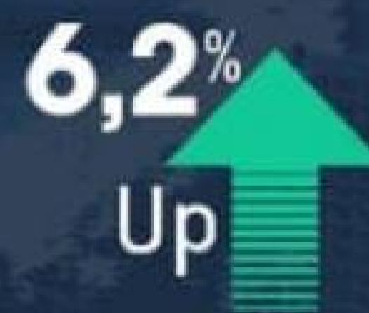
Average Daily Rate (ADR)